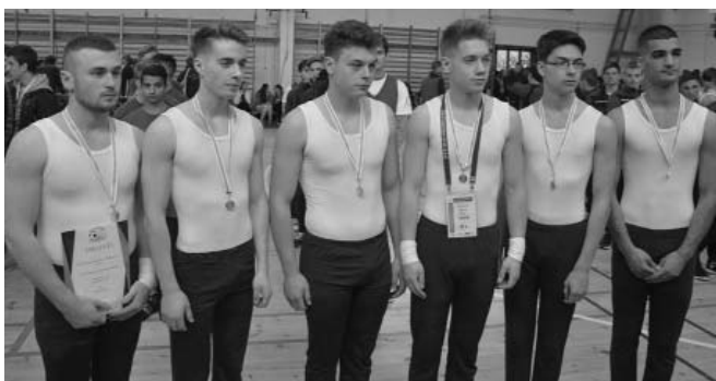
A Mórincz győztes fiú szertorna csapata

Az időjárás alaposan próbára tette a szervezők kreativitását, pillanatok alatt kellett a rendezvény eseményeinek átszervezésével kapcsolatos döntéseket hozni, illetve az azokkal kapcsolatos szervezői, logisztikai feladatokat ellátni. A havazás miatt később kezdődtek a kispályás labdarúgó mérkőzések, illetve az első napon elmaradtak a kézilabda csoportmérkőzések, ezek a második napon új időtervvel kerültek megrendezésre. Az atlétikapálya felázás miatti alkalmatlansága