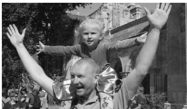
Sokan voltak kíváncsiak a kunok színes forgatagára