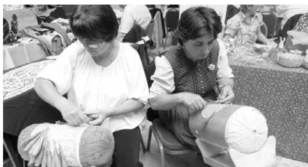
Bemutakoztak a csipkeverőink...