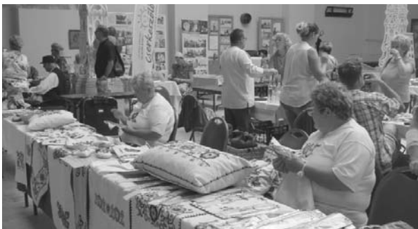
...és a kunhímzőink is