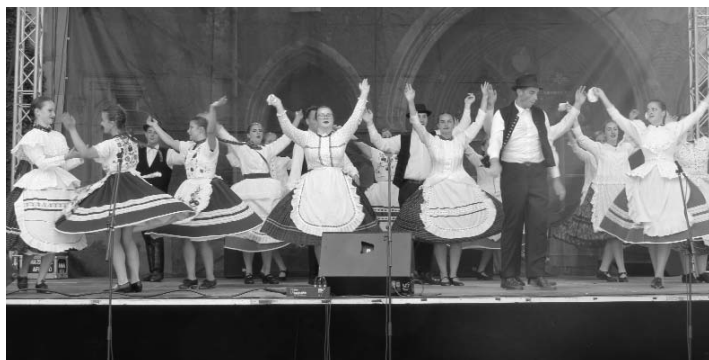
A Nagykun Táncegyüttes ifjúsági csoportjának fergeteges színpadi produkciója sokakat magával ragadott