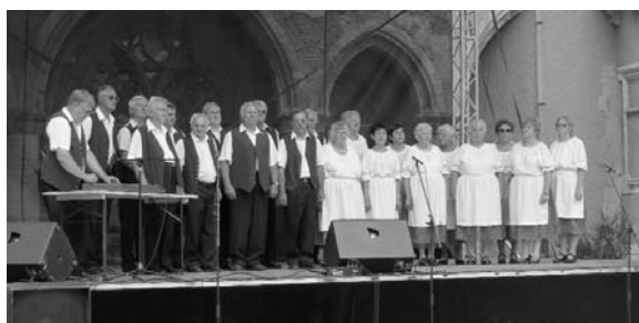
A '48-as Olvasókör népdalkőrei színes kunsági dalokból adtak ízelítőt