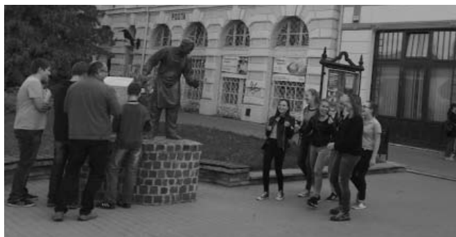
A Móricz Zsigmond Református Kollégium tanulói

Szeptember 27-én, a turizmus világnapján helyi diákok kipróbálták új városmarketing applikációnkat, a Kun Kulcs Küldetést. A gyerekek játszottak, versenyeztek egy jót úgy, hogy közben egy kicsit másképp is megismerték a várost. És bár ez esetben külön kértük, hogy legyen kézből telefonjuk, elmondásuk szerint mégis igazán jól érezték magukat együtt, közös élményt szereztek a telefon használata mellett is. Köszönjük mindannyiójuknak a részvételt, az iskoláknak az együttműködést, a Vigadó Kulturális Központnak a segítő együttműködést! Gratulálunk a nyertes csapatoknak! Várjuk őket októberben az ingyenes fürdőzésre!