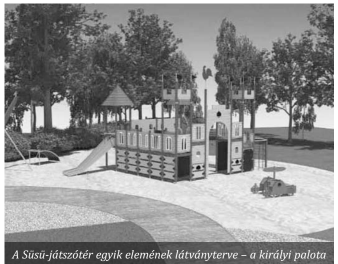
A Süssig-játszótér egyik elemének látványterve – a királyi palota