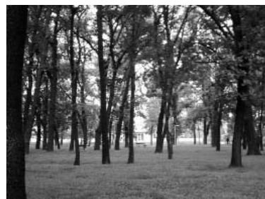
Az Erzsébet királynéről elnevezett, felújítás előtt álló liget