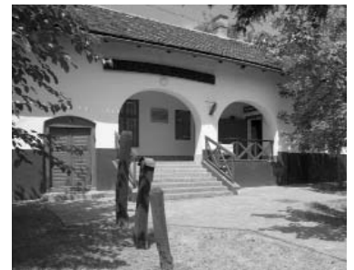
Az 1781-82-ben eredetileg csárdának épült „Morgó” ma műemlék, Néprajzi Kiállítóterem