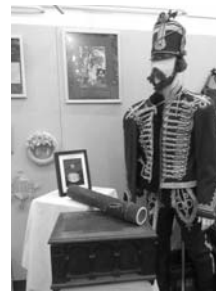
A nagykun kapitány választásának hagyománya