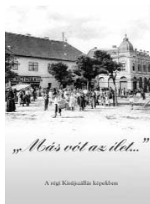
A „Más volt az élet...” című könyv városunk számos régi építészeti értékét is bemutatja