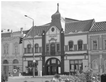
Az 1911-12-ben felépült, 2015-re felújított Vigadó, a város kulturális életének legfontosabb színtere