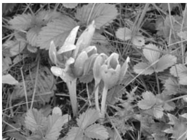
Őszi kikerics Kisújszállás határában, védtett növény