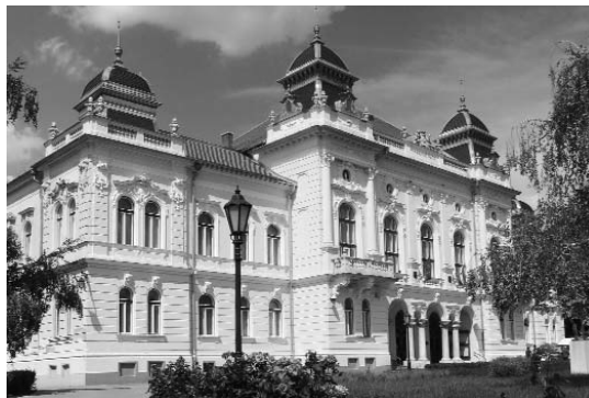
Az 1899-1900 között épült, 2014-re részben felújított „Városház-palota”, mely műemlék épület