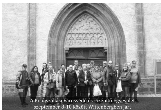
A Kisújszállási Városvédő és -Szépítő Egyesület szeptember 8-10 között Wittenbergben járt