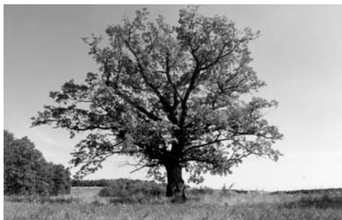
Védtett érték az Öregerdő több száz éves kocsányos tölgyeivel