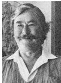
A kisújszállási születésű Csukás István szépirodalmi munkássága