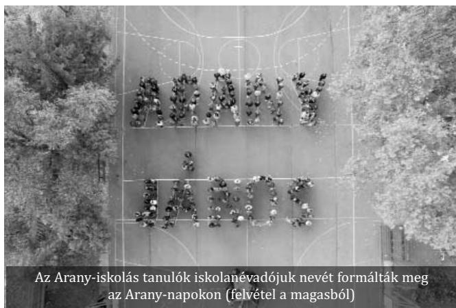
Az Arany-iskolás tanulók iskolanévadójuk nevét formálták meg az Arany-napokon (felvétel a magasból)

(Dr. Ducza Lajos avatóbeszéde nyomán - Szerk.)