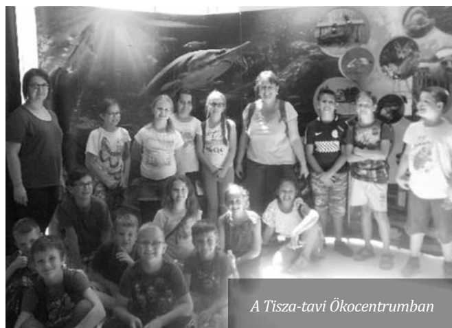
A Tisza-tavi Ökocentrumban