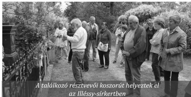
A találkozó résztvevői koszorút helyeztek el az Illéssy-sírkertben