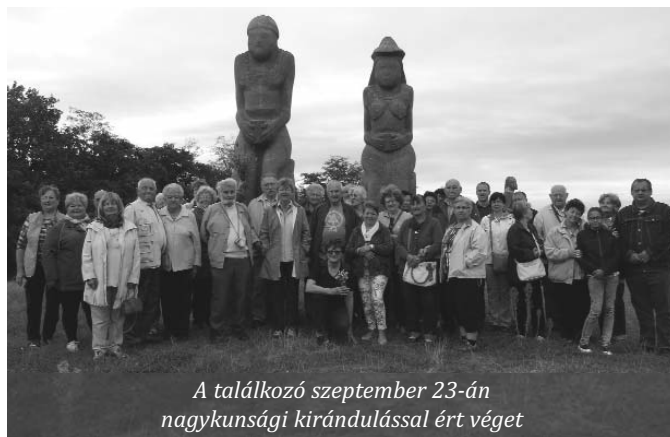
A találkozó szeptember 23-án nagykunsági kirándulással ért véget