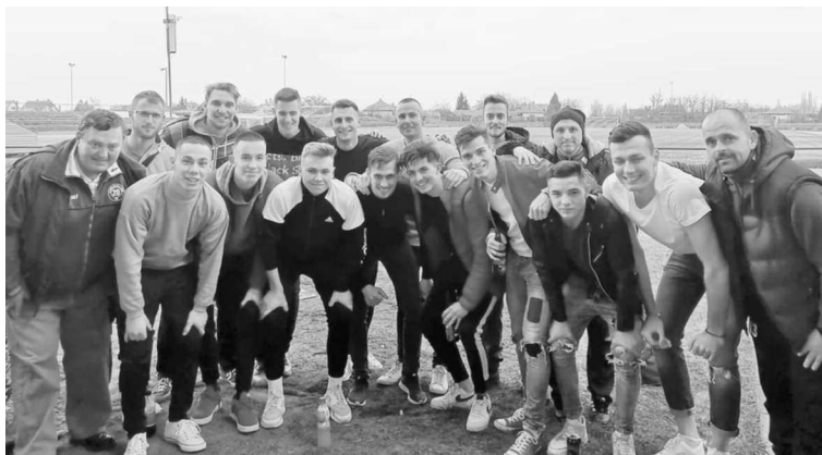
A felnőtt futballcsapat a mezőtúriakkal vívott sikeres meccs után

A bajnokság folytatásában Mezőtúr csapatához látogattunk, akik a tabella 2. helyén tanyáztak. Joggal merült fel sok emberben a kérdés, hogy sikerül-e pontot csenni a jelenlegi ezüstérmestől. A válasz IGEN, nem is akárhogyan. A mérkőzés kezdetkor nyomást helyezett