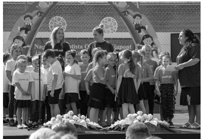
A tanévnyitón az elsős gyermekek fogadalmat tettek

Az ünnepi műsort színessé tette az első osztályosok fogadalomtétele, a harmadikosok néptánca, a kórusok éneke és a most induló gimnáziumi osztály képviselőiben elhangzott szavalt. A rendezvényen felléptek a Baptista Alapfokú Művészeti Iskola tanárai. Megható volt a nemzeti imádságunkat, a Himnuszt kamarazenekari kísérettel énekelni.