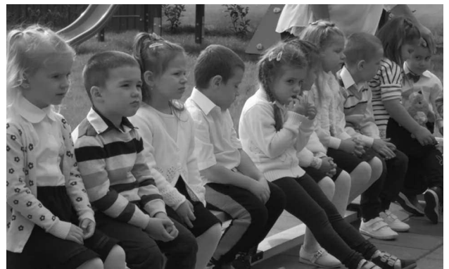
Az óvodaavató ünnepségen a középső csoportos óvodások adtak műsort