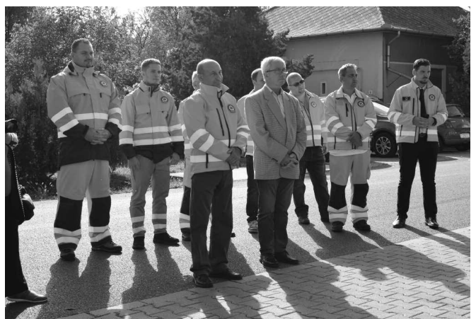
A Kisújszállási Mentőállomás tagjai

Képviselő-testületünknek – és azt gondolom, mindenkinek – fontos annak tudata, hogy a mentési feladatokat ellátó személyek is minél jobb körülmények között és minél korszerűbb eszközökkel dolgozzanak. Ezért javaslom tisztelettel másoknak is, hogy lehetőségeik szerint legyenek a Kisújszállási Mentőszolgálat támogatói.