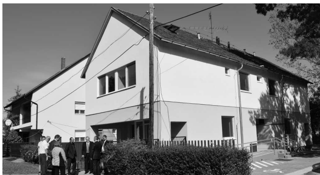
Rákóczi u. 16.

Ilyen tartalmú szolgáltatáscsomaggal fordultunk tehát a városunkban élő fiataljaink felé. Olyan segítő, támogató intézkedésekről van szó, amelyek valamilyen módon, közvetve vagy közvetlenül arra motiválják őket, hogy itthon maradjanak, itthon boldoguljanak, Kisújszálláson.