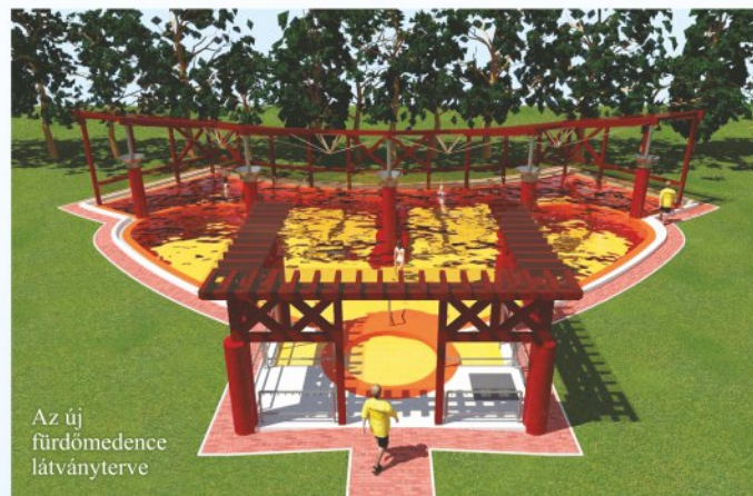
Az új fürdőmedence látványterve

A turizmus érdemi fejlődése városunkban 2010 szeptemberének végén kezdődött, amikor felavattuk az Ifjúsági Szálláshelyet, majd folytatódott a Kumánia Gyógy- és Strandfürdő, valamint a Hotel Kumánia*** superior 2012. májusi megnyitásával. Kisújszállás, a Nagykunság kulturális fővárosa a múltban nem igazán volt klasszikus turisztikai célpont, de a fürdő és hotel színvonalas és keresett szolgáltatásaival, valamint jó marketingtevékenységével városunk legjelentősebb, térségünk egyik legkeresettebb turisztikai létesítménye lett, mely hamarosan új kültéri termálmedencével várja a kikapcsolódni vágyókat.