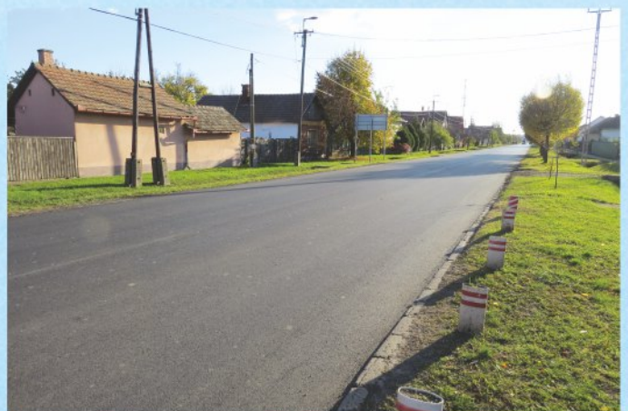
Elkészült a Malom utca