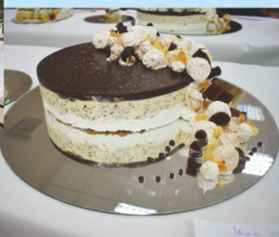
7 éves lett a Kumánia