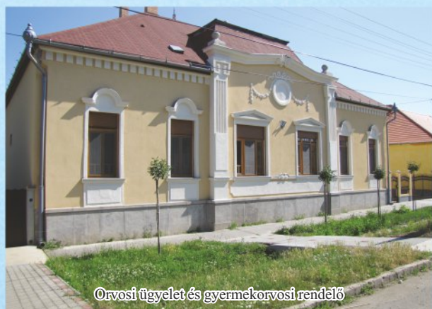
Orvosi ügyelet és gyermekorvosi rendelő