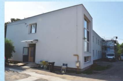
A Szociális Otthon „Pavilon” épülete

A Városháza az energetikai felújítása során a műemlékhez illő hőszigetelt nyílászárókat kapott, az épület homlokzata szép új köntösbe bújt, a színelőfalak mögött napelemes rendszer került a belső udvari tetőre, hőszigetelést kap a padlás, valamint korszerű lesz az épület rendőrségben belüli fűtési rendszere is.