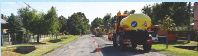
Munkában a Kossuth utcán