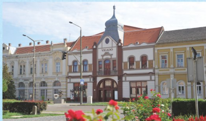
A Vigadó Kulturális Központot 2015. szeptember 25-én a Kivilágos Kivirradtig Fesztivál előestéjén avattuk fel.