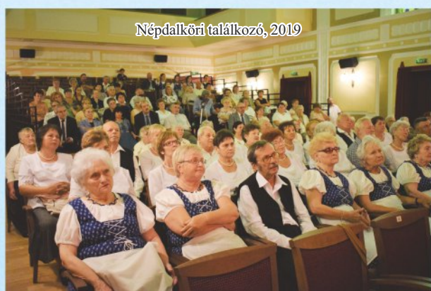
Népdalköri találkozó, 2019