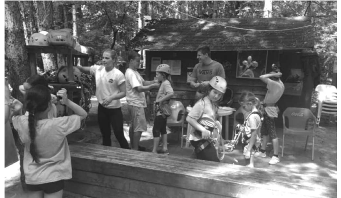
A gyerekek a ceglédi kalandparkban próbálhatták ki mászó tudásukat