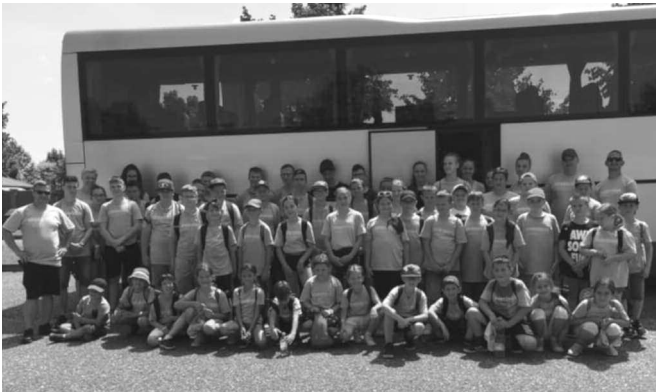
A tábori csapat

A jelentkezések elindításánál kisebb közösségben gondolkodtunk, de olyan nagy volt az érdeklődés, hogy 60 főnél kellett lezárnunk a tábor létszámát. A program megvalósítása során négy csoportban sportolhattak a gyerekek. Voltak, akik a labdarúgás iránt érdeklődtek, voltak, akik szívesebben kosárlabdáztak, és voltak, akiket a szabadidős, rekreációs játékok kötöttek le. Helyszíneink a Móricz Zsigmond Református Kollégium tornatermei és sportpályái, valamint a városi strand medencéi voltak. A napközis jelleggel működő táborunkban hét testnevelő foglalkozott a gyerekek mozgásfejlesztésével.