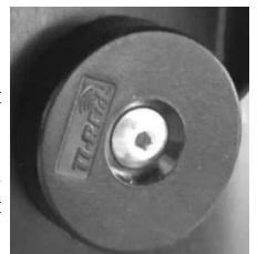
kép az RFID-ről

Amennyiben az Ön által használt kukan nincs vonalkód, vagy bármilyen egyéb a szerződésével kapcsolatos kérdése merül fel kérjük, hívja fel az NHSZ Tisza Nonprofit Kft. ügyfélszolgálatát a +36 59 510-011 telefonszámon, vagy küldjön elektronikus levelet az info.tisza@nhsz.hu címre és hivatkozzon levelünkre („edényazonosítás”).