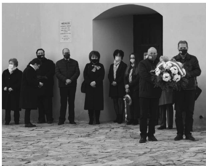
A résztvevők koszorúik elhelyezésével fejezték ki együttérzésüket