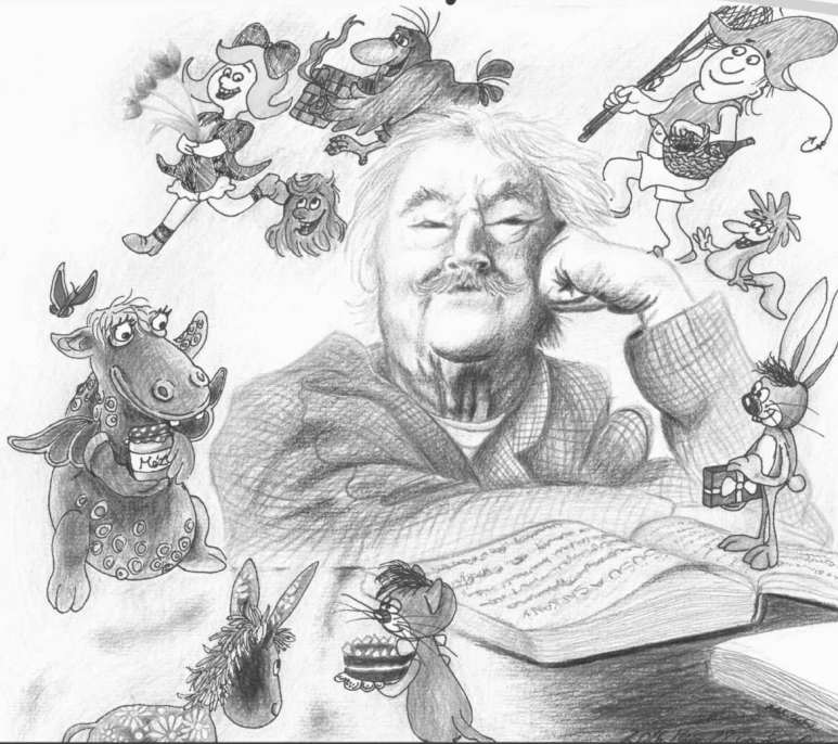
A rajzot Fehér Noémi készítette.

Jelentkezési határidő: 2021. április 30.