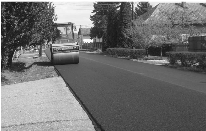
Útjavítás a Nagy Imre utcán