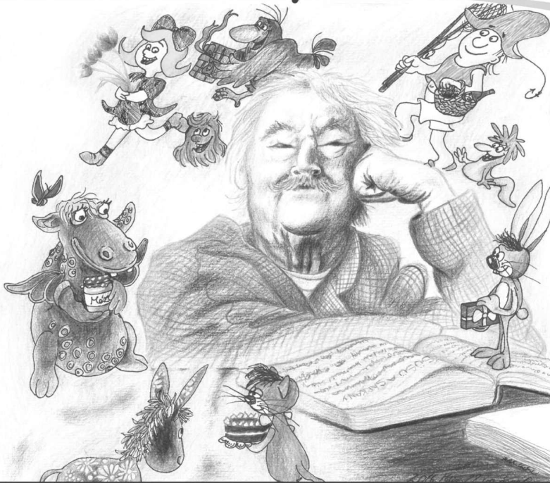
A rajzot Fehér Noémi készítette.

Kisújszállás Város Önkormányzata a TOP-5.3.1-16-JN1-2017-00006 kódszámú, Karcagi kistérség közösségi fejlesztése című projektben könyvet jelentet meg Csukás Istvánról.