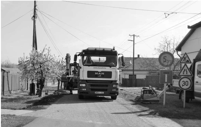
Zajlanak az útjavítások, képünk a Kert utcán készült

Hamarosan befejeződnek az útfelújítási munkálatok. A mintegy 57 millió Ft-ból megvalósuló beruházáshoz 40 millió Ft támogatást nyert az önkormányzat, így újabb négy útszakasz felújítására kerülhetett sor városunkban. A Kert utcán, a Csorbai utca Veres Péter utcától kifelé vezető szakaszán és a Nagy Imre utca, a Petőfi utca és az Ifjúság útja közötti szakaszán az útburkolat-felújítási munkálatok a napokban befejeződnek. A Gyalpár utca, József Attila és a Mester utca közötti szakaszának útalap-megerősítési és útburkolat-felújítási munkálatai jelenleg még zajlanak, de várhatóan május közepére ez az útszakasz is teljesen megújul.