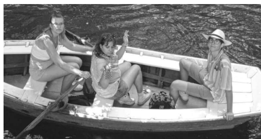
Valóság vagy filmforgatás?

Bízunk benne, hogy nyertes pályázatok révén a jövőben is számos hasonlóan izgalmas, szakmai szempontból is hasznos programban vehetnek majd részt az Illéssy legkiválóbb tanulói.