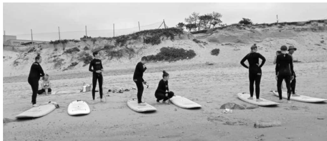
Itt még magabiztos lábakon állva a szörfdeszkákon

A nyári szünetben ismét lehetőség nyílt arra, hogy egy Erasmus+ program keretében néhány diákunk külföldön tölthessen el két hetet, és ott teljesítsék a kötelező gyakorlati idejük egy részét. Idén nyolc vendéglátásszervező diákunk utazhatott Portugáliába, Bragába. A szerencsés résztvevők számára a program tele volt „életükben először” élményekkel. Először ültek repülőre, láthatták a végtelen óceánt, és mártózhattak meg annak hús vizében, próbálhatták ki a szörfözést, bolyonghattak a romantikus hangulatú portugál városok, Porto, Guimaraes, Ponte de Lima utcáin, hajózhattak a gyönyörű Duoro folyón, tanulhattak portugálul, és élvezhették, hogy jobban beszélnek angolul néhány portugálnál. A gyakorlatukat három étteremben teljesítették pincér-, illetve szakácsstanulónként, ahol helyi alapanyagokkal és konyhai eljárásokkal is megismerkedtek.