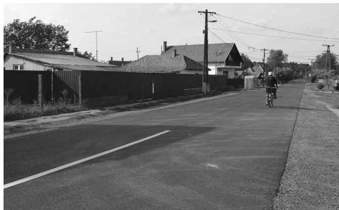
Befejeződött a Szélmalom utca felújítása