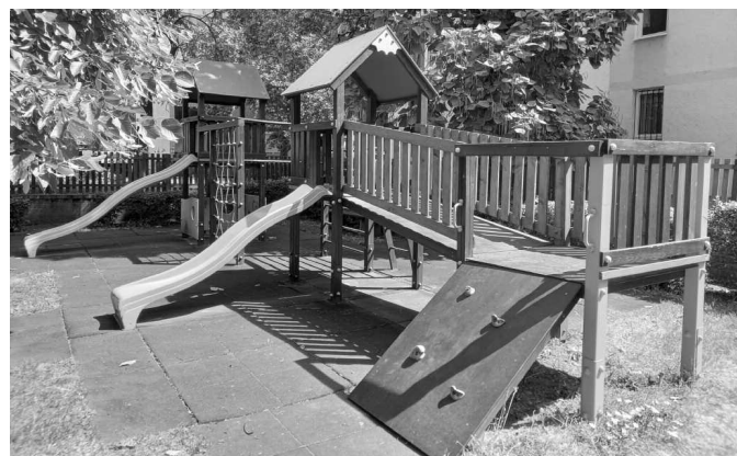
Játszótereinken az eszközöket felújítottuk, a szükséges elemeket lecseréltük

Az elnyert támogatásoknak és önkormányzati hozzájárulásnak köszönhetően, lehetőségünk nyílt az önkormányzati tulajdonú közutak karbantartási és javítási munkálatainak elvégzésére, a Szélmalom és a Cserepes utca, valamint a Turgonyi út teljeskörű felújítására. Befejeződött a Zártkerti program keretein belüli pályázatunk kivitelezése, mely során a Vásár utca folytatásaként, a Lógókertbe vezető földút közel 750 m hosszan új alapot kapott, és ugyanezen útszakaszra 4 db térfügglő kamerát is telepítettünk.