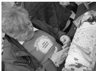
Készül a gyönyörű csipke