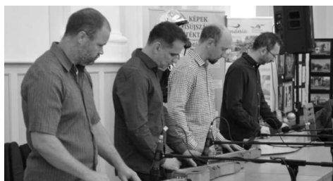
A Debreceni Citerazenekar élvezetes műsorát hallhattuk