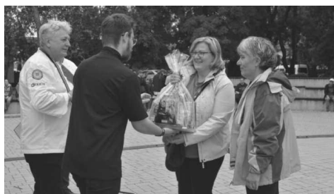
A főzőverseny eredményhirdetése