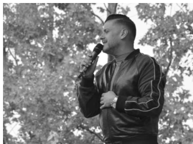
Kökény Attila műsorára sokan voltak kíváncsiak