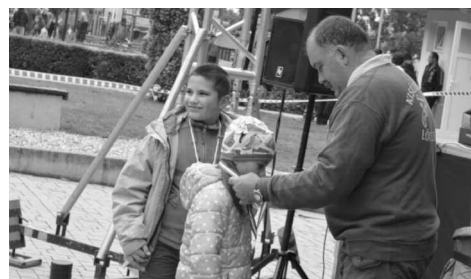
A Zöltség Kupán a gyerekek is jeleskedtek