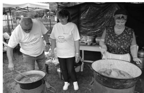
Jó hangulatban telt a főzés