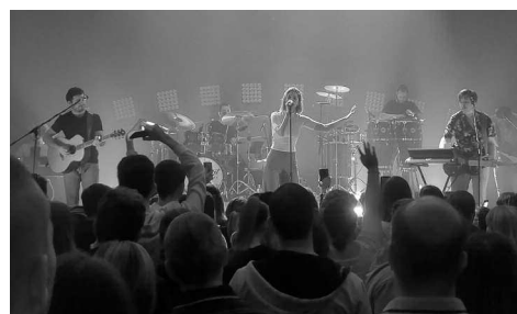
A Margaret Island koncertje óriási sikert aratott