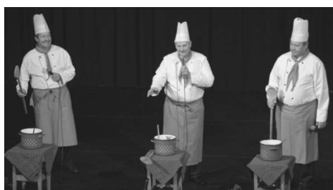
Ismét a színpadon köszönthettük az Éneklő Szakácsokat