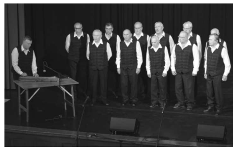
A '48-as Olvasókör Dalárdájának nótái betöltötték a Vigadót

Szeptember eljövetelével búcsút intettünk a nyári napsugaraknak, s új évszakot köszöntöttünk, a borongós, fáradt ősz. A meleg hónapok mintegy lezárásaként idén is megrendezésre került a már hagyománnyá vált Kivilágos Kivirradtig Fesztivál, Kisújszállás legnagyobb gasztronómiai, kulturális és családi rendezvénye. Az oly sokunk által várt eseményen káposztás és bográcsos ételek főzőversenye, népzenei és könnyűzenei koncertek, mesterségek utcája, és megannyi érdekes program várta a kilátogatókat. Tekintsék meg a fergeteges hangulatról, a boldog pillanatokról készült képműállításunkat!