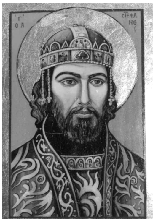
Szent István – ikon

A közösség ereje az, ami máig összetartja nemzetünket, országunkat, azon belül otthonunkat, a városunkat. A Kisbíró ezen ünnepi számában olyan kitartóan, fáradhatatlanul, szívvel-lélekkel munkálkodó ismert és elismert, köztisztviselőket álló személyeket mutatunk be , akik meghatározó szerepet töltenek be városunk közösségi életében – munkásságuk elismeréseként városi és vármegyei kitüntetésekben részesültek . Megragadom az alkalmat, hogy e helyen is szeretettel meghívjak minden kedves érdeklődőt az augusztus 17-20. között megrendezendő Városnapok programjainkra, azon belül a Szent István-napi ünnepségünkre , ahol városunk kitüntetettjeit , valamint a Kisújszállásra látogató testvértelepüléseink képviselőit köszöntjük majd.