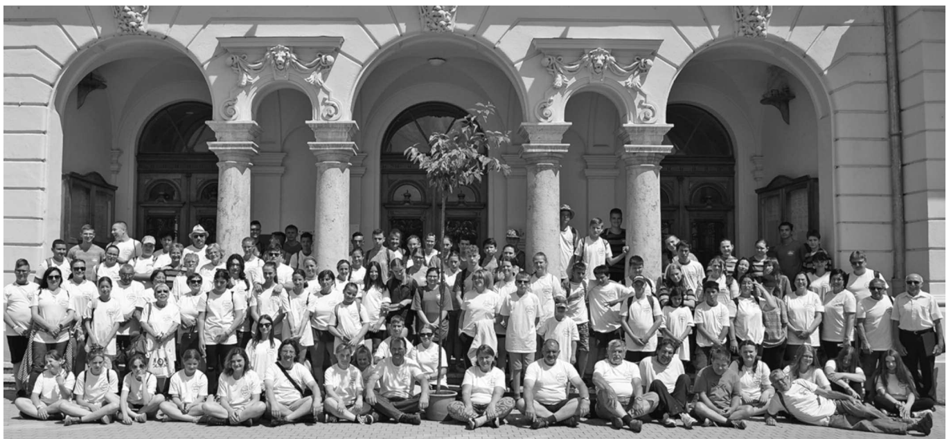
A tábor résztvevői