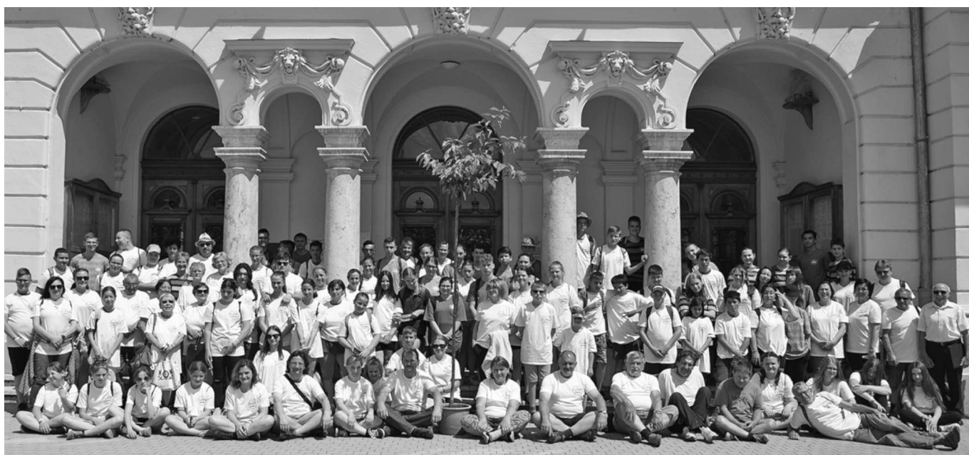
A tábor résztvevői