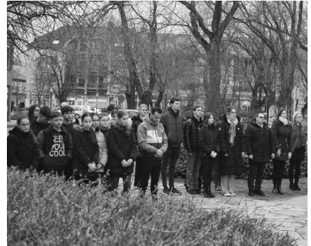
A kommunizmus áldozatainak emléknapja alkalmából rendezett megemlékezés résztvevői a Református templom előtti téren