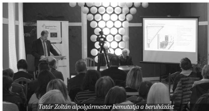
Tatár Zoltán alpolgármester bemutatja a beruházást