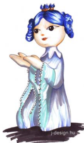
Süsü játszótère, Kisújszállás, Városháza park

Kiskirályfi figurája Üvegszálerősítésű kompozit (125 cm)