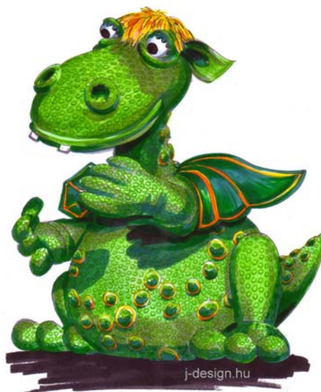
Süsü játszótère, Kisújszállás, Városháza park

Hal ivókút Üvegszálerősítésű kompozit (95 cm)