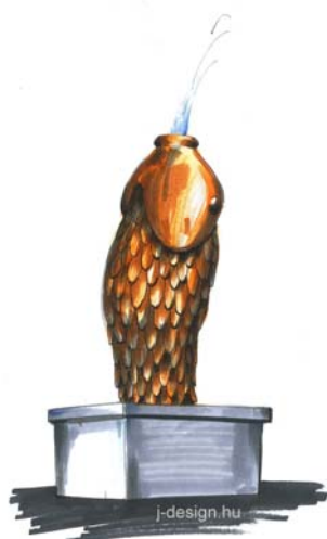
Süsü játszótère, Kisújszállás, Városháza park

Hal ivókút Üvegszálerősítésű kompozit (95 cm)