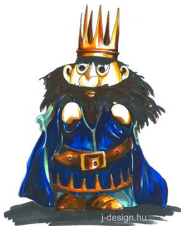
Süsü játszótéren, Kisújszállás, Városháza park

Torzonborz király Üvegszálerősítésű kompozit (120 cm)