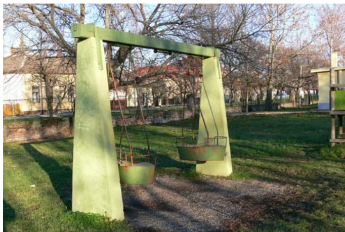
1. Egykori masszív vashinta-hajó a játszótéren; ma már el van bontva (HNG, 2007)