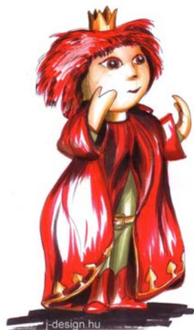
Süsü játszótère, Kisújszállás, Városháza park

Süsü figura vázlat Üvegszálerősítésű kompozit, (250 cm)