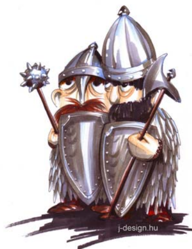
Süsü játszótéren, Kisújszállás, Városháza park

Torzonborz király Üvegszálerősítésű kompozit (120 cm)