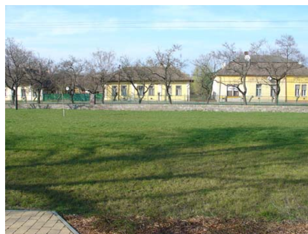
2. Az üresen álló játszótér a Csányi-sétánytól; nyugati oldal, háttérben a téglafallal és a Nyár utcával (HNG, 2016)