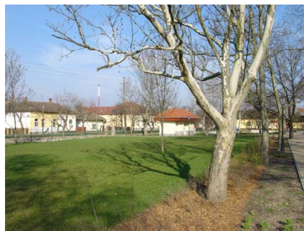
3. Az üresen álló játszótér keleti oldala, háttérben az illemhelyiséggel (HNG, 2016)